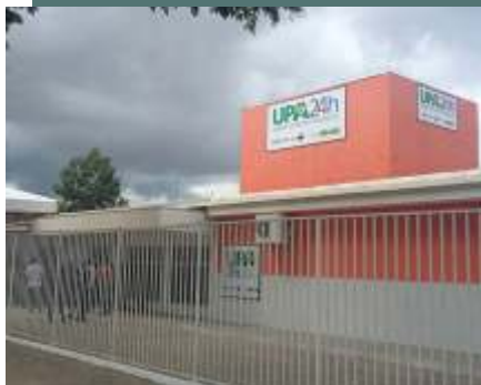
UPA - Teixeira de Freitas